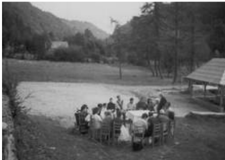
Szeltersz 2002 Selters

A Szeltersz-i táborozás résztvevőjeként, melyre a „Fraternitas” szervezésében került sor szeptember 2 és 8 között, e fenti idézet igazát bizonyítom ott tapasztalt élményeimmel.