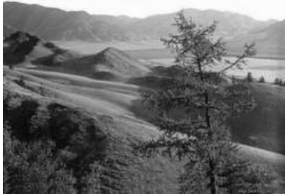
Isten tenyerén / În palma Domnului

A föld előnyét nem élvezheti mindenki egyformán! És, ha végig olvasom, rájövök, hogy csak Isten ment meg a pesszimizmustól. Ki ad esélyt a ma emberének?