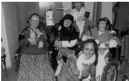
Farsang – Fraternitas - Carnaval