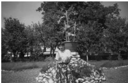
Lala az otthon udvarán / Lala în curtea căminului

1983 október 22-én született Bukarestben. Nem ő a család egyedüli gyereke, még van három fiútestvére: egyikük 25 éves, nő, Bukarestben él, a másik kettő (ikrek) jelenleg katonai szolgálatot teljesítenek. Édesapja meghalt, az édesanyja most is Bukarestben él, egyedül egy háromszobás lakásban. Egy ottani készruha gyárban dolgozik. A lányát nem látogatja, állítólagos nehéz anyagi helyzete miatt.